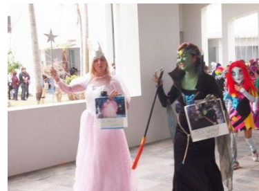
先生も子どもたちに負けてません!!