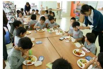
みんなでいただきます！