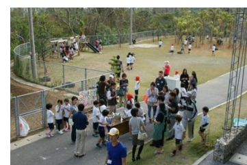
多くの方々のご参加、ありがとうございました。