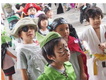
これからパレードです!!