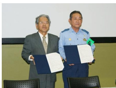
防犯カメラ寄贈、ありがとうございます。

うるま市警察署から防犯カメラの寄贈を受けました。警察関係者から「今回の寄贈を通して、子どもたちの防犯に対する意識作りにも役立ててもらえたら嬉しい」という言葉をいただきました。