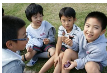
ホクホクの焼き芋、おいしいな♪