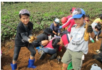
僕のお芋大きいでしょう!?