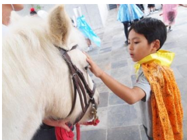
UMABUの馬も参加したよ!

今年も、Autumn Festival を開催しました。子どもたち、保護者、スタッフ、それぞれが思い思いの衣装をして校内の回廊に大集合!! その後、クラス毎に回廊をパレードし、衣装をお披露目しました!! 子どもたちは様々なアイデアを駆使した手作り衣装に身を包み、いつも以上ににぎやかな一時となりました。パレードの後は、「スタンプラリー」を行いました。子どもたちは“trick or treat”と言いながら、各クラスやオフィスを回り、お菓子の代わりにスタンプやシールをコンプリートしていききました!! 毎年、子どもたちの衣装アイデアには驚かされています。来年のフェスティバルも楽しみです!!