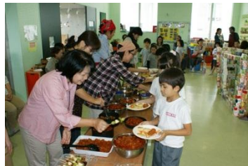
おいしそうな料理が並びます。