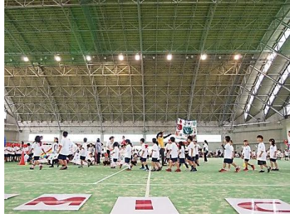
Opening Ceremony クラス毎に手作りのFLAGを掲げて入場！

12月1日(土)に開催されたファミリースポーツデイは、今年で2回目。今回は沖縄県総合運動公園屋内競技場で行いました。午前中は徒競走など7つの競技を行い、子どもたちは自分で選んだ2つの競技に、練習を積んで参加しました。午後は学年ごとの競技となり、幼稚園や小学校1・5年生では保護者参加型で行われました。子どもたち一人一人が、日頃の練習の成果を十分に発揮することのできた、素晴らしいスポーツデイとなりました。また、皆さまの熱心な応援とご協力に心から感謝申し上げます。