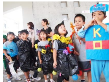
手作り衣装で変身!!