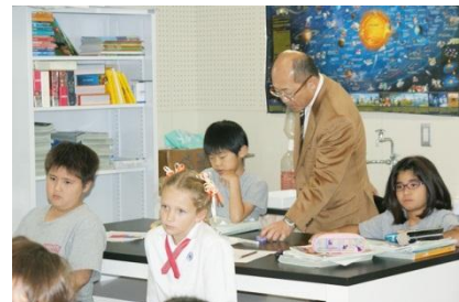
3C(インターナショナルコース)の理科