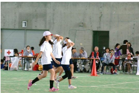
Event 5 ゼリービーンズ運び スプーン上のゼリービーンズを落とさず慎重に。