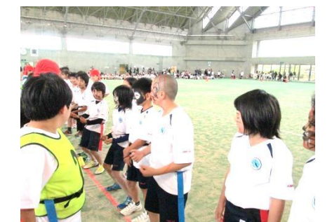
4年生 旗とり合戦 腰のタグを守りながら、相手陣地の旗を取る!!