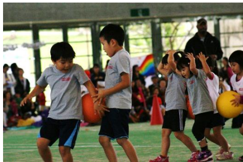
Event 3 ボールはさみレース 2名一組でボールをはさみ、落とさず前進!!