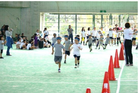
Event 7 ミニマラソン まさにマラソン! いっぱい走りました!!