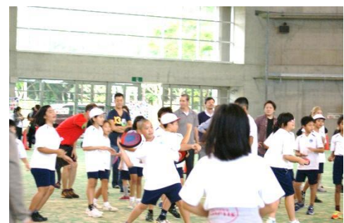
5年生 ドッチビー 保護者さんと一緒にゲームを楽しみました!!