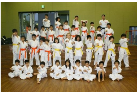
黒帯目指してがんばろう！

キッズクラブの中にある空手クラブで、希望者による昇級試験が行われました。それぞれ、黄色帯(8級)とオレンジ帯(7級)に挑戦し、多くの子どもたちが昇級することができました。技をさらに磨いて、さらに昇級できることを楽しみにしています。