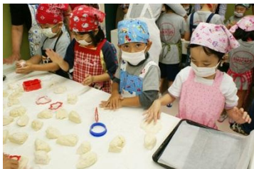
スコーンの形は星形にしよう♪