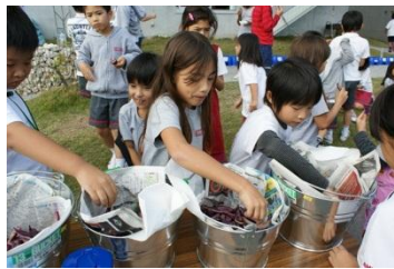
芋チップスは、やみつきになる味！