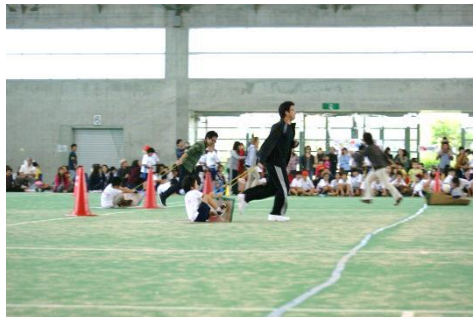
幼稚園 マジックカーペット スリル満点、園児は上手に乗っていました!!