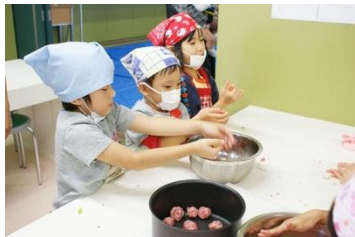
ミートボールを丸くして・・・