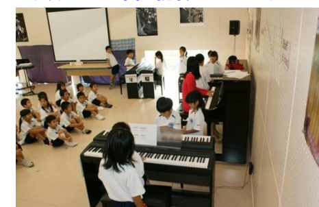
先生の伴奏にあわせて、ピアノ演奏をがんばりました。

1年生の音楽の授業にピアノを取り入れ、日頃から練習しています。入学当初は弾けなかった子どもたちも多かったのですが、みんな頑張ってピアノコンサートを行いました。コンサートでは、先生の伴奏に合わせて「ぶんぶんぶん」を弾きました。次はどんな曲に挑戦するのかな。