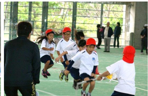
Event 6 大縄跳び 息を合わせて～、ジャンプ!!