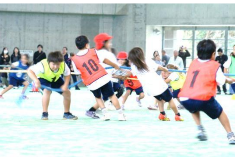
3年生 走って引いて! 綱取り競争!! 何本の綱を取れるかな?