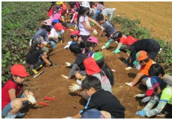
お芋はどこにうまっているかな・・・？

2年生の子どもたち86名が読谷村まで出かけて、芋ほりを体験しました。芋ほりを初めて経験する子どもたちもおり、土の中から出てくるたくさんの芋に、「やった！大きい芋を見つけた！」と歓声をあげる児童もいました。友達と芋ほり競争をしたり、とれた芋の重さを比べたりとそれぞれ楽しい時間を過ごしました。収穫した芋を学校に持ち帰り、保護者を招待して焼き芋パーティーを行いました。芋を細くスライスして油で揚げた「芋チップス」や紅イモスイーツ作りにも挑戦しました。定番の焼き芋は、バザーの品物として、訪れる人々に売り込みました。2年生は、算数で「量り」について学んでいて、重さを確認しながら料金を決め、売り上げをノートに書き込みました。また、購入する量に応じて割引をするなど、お店屋さんになった気分を味わいました。パーティーには、多くの保護者の皆様にお越しいただき、子どもたちだけではなく教職員も楽しいひと時を過ごすことができました。たくさんのご協力、ありがとうございました！