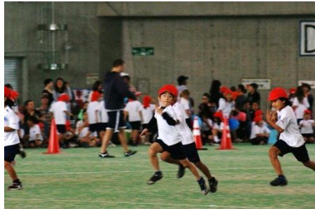
Event 1 徒競走 運動会と言えばこの競技！ DASH!!