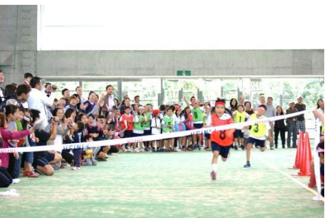
2年生 全員リレー クラス対抗、全員参加で盛り上がりました!