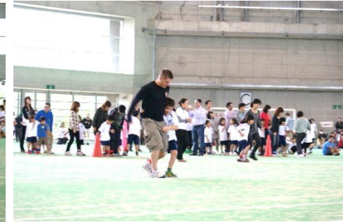
1年生 二人三脚 クラス対抗、息を合わせてゴールを目指す!!