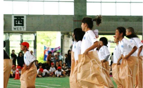
Event 2 カンガルレース 麻袋に入って JUMP!! JUMP!!