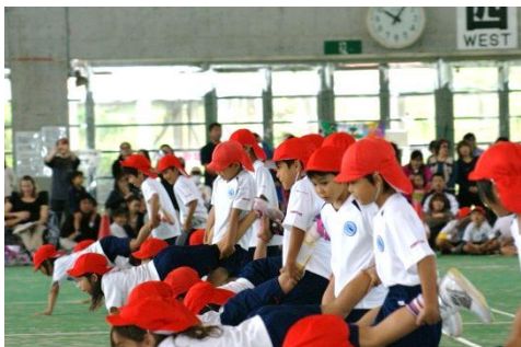
Event 4 手押し車 とても体力が必要な競技!! ゴールが遠い～。