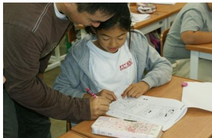
ももココロさんにご指導いただきました。