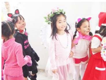
かわいい衣装ができました♪