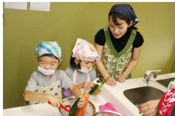
皮むきに挑戦！以外にむずかしい。

幼稚園で、外国人講師をお招きしてクッキング教室が行われました。子どもたちは、ミートボール、サラダ、スコーン作りにも挑戦しました。指示は英語で行われましたが、躊躇することなくクッキングを楽しむことができました。サラダづくりではピーラーを使って、なんとか野菜の皮をむくことができました。お父さんやお母さんがキッチンでミートボールを煮込むのを手伝いする為に、ミートボールを大きすぎず小さすぎず、きれいに丸めていきました。しばらくすると、いい香りがたどよい、外で体育の授業をしていた1年生の子どもたちが、うらやましそうにキッチンを眺めていました。出来上がったお料理をみんなで協力して教室に運び、ビュッフェ形式によるランチをいただきました。盛り付け役はもちろんお父さんやお母さん！子どもたちは配膳される度に「Thank you」と言いながら、早く食べたい気持ちを抑えて、みんなの配膳を待ちました。自分で作ったミートボールやスコーンをお父さんやお母さんと一緒に食べることで、みんなで食事をする楽しさや、いつもご飯を作ってくれる人の気持ちを感じることができたかもしれませんね。