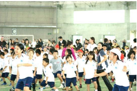
Break Time フラッシュモブ 全員で・・・、ダンス! ダンス!! ダンス!!!